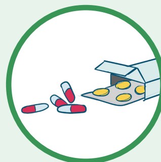
Bien suivre son traitement