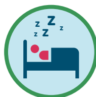
Troubles du sommeil