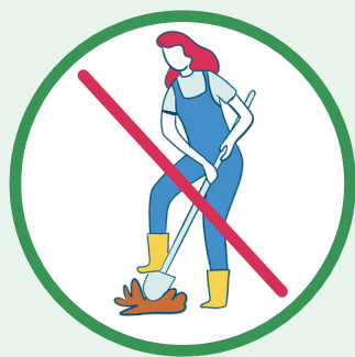
Éviter le jardinage

En cas d'allergie respiratoire aux pollens et pour éviter que les symptômes ne soient exacerbés, il y a quelques mesures à prendre pour l'éviction des allergènes.