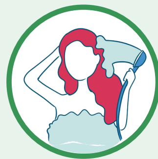
Se rincer les cheveux